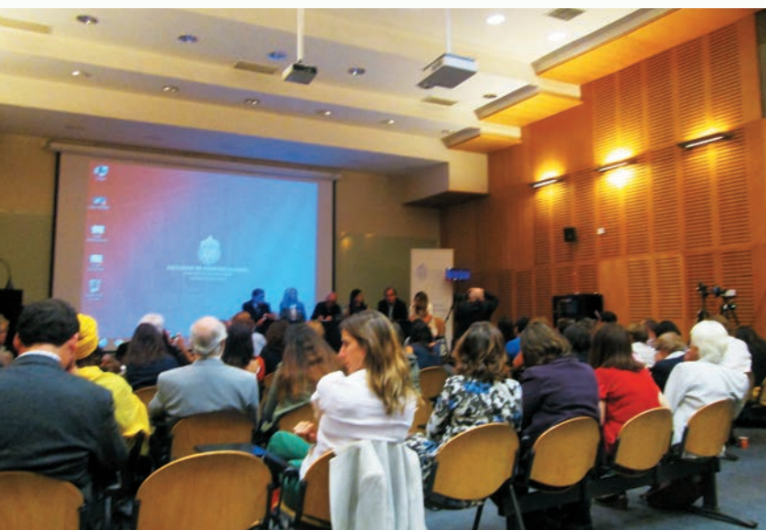
無人飛機的議題吸引與會代表的焦點。

參加這次 AMMPE 的第 22 屆年會，如同在變動的宇宙之中，登上一個觀察的平台，讓與會者回顧歷史，聆聽媒體業者和專家的心聲，審視傳播科技的未來動向，促進會員彼此的認識和了解。若和敘利亞難民在希臘島外海翻船的新聞相較，AMMPE 的 22 屆年會是全球化景觀之中，一幅十分祥和的畫面。