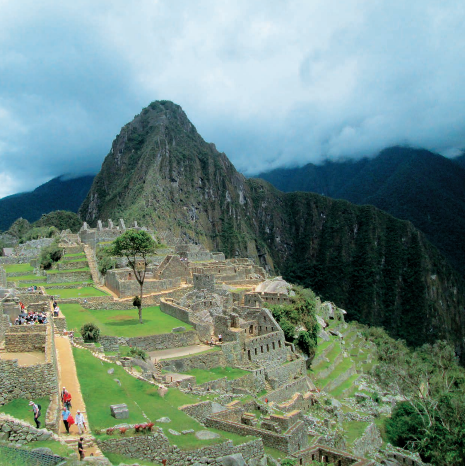
從高處眺望馬丘比丘，全景盡在眼下。