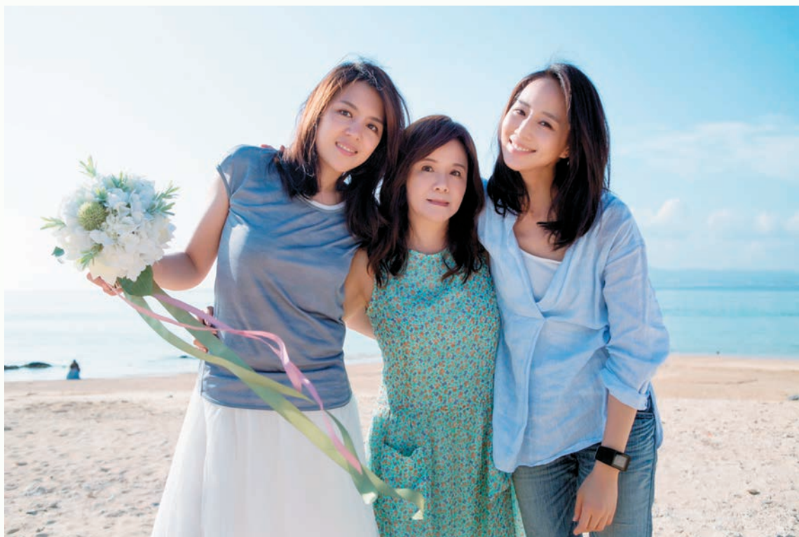
如晴和一雙傑出女兒。

緣。直至漸老，始驚覺，讀書豈敢如玩月，因不及前人聰慧。再說，文章是案頭的山水，是有字句的錦繡，我只敢恭謹優游。