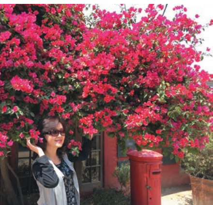
小陶子陶醉在花叢裡。

藍花楹太高無法合照，只能多眨幾次眼，把美留在眼底天際；但大夥兒仍忍不住在九重葛前留影，一種回顧逝去青春的概念。