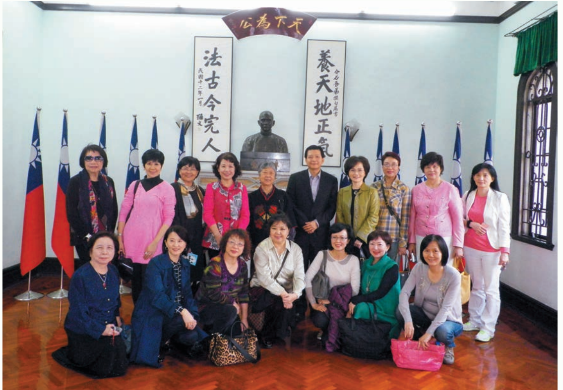
參觀座落在澳門的國父紀念館時合影。

每年年底的大會，我也開始負責小小工作，製作摸彩券，核對出席名單。同時，我也用心準備理監事必須提供的摸彩禮物，每次遇到好東西，我就會想，今年年底用來摸彩，應該不錯喔！我喜歡看到大家打開禮物的開心表情。