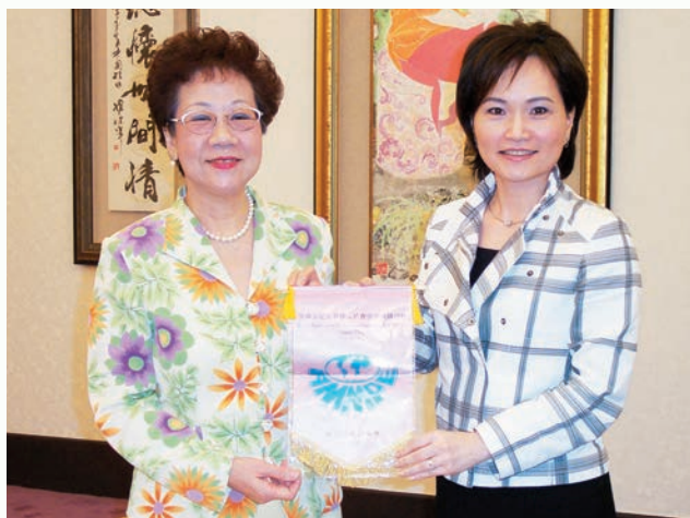
沈春華致贈呂秀蓮副總統會旗。

奉 命要為本會成立30周年，從卸任理事長的角度，寫些回顧與感言。這才驚覺，當年在蘇玉珍大姊的推薦下，我加入協會已然25個年頭，而擔任理事長和國際總會會長竟也是10年前的事了。