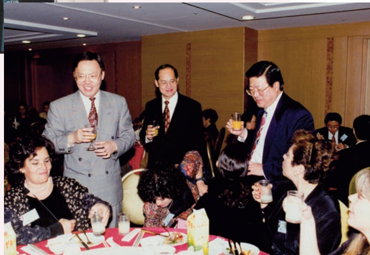
AMMPE 多年來蒙政府部門支援補助，得以持續活躍於國際舞台。

由於 AMMPE 屬 NGO 非營利組織，舉辦活動早期大多仰賴政府部門，如外交部、行政院新聞局、文建會等補助經費，歷任的部會首長都很支持，其中最特別的當屬胡志強先生。他自 1992 年任新聞局長起，就與 AMMPE 結下不解之緣，與本會姊妹情深。1998 年 AMMPE 在希臘舉辦第 14 屆國際年會時，時任外交部長的胡志強就給了本會莫大的支持，那年組了 35 人陣容最龐大的代表團參加。