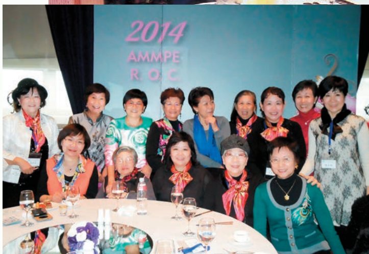
▲◀每年年會是會員們最盼望的聚會。

搭大有巴士去桃園機場，接待剛下飛機的各國代表再送她們到台中，那時候好多姊妹都投入這項工作，大家輪班，我才明白群策群力是什麼意思。