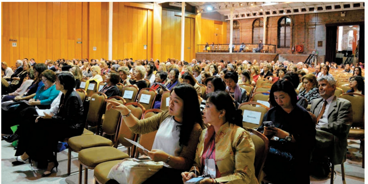
與會各國代表齊聚一堂聆聽貴賓致詞。

這次在智利舉行的世界女記者與作家國際年會，安排的每場論壇都很令人印象深刻，議程的安排也非常有趣。一位記者在發言做結語時說：「要成爲記者前，應該要先 Be a good person」。在此亦以此與大家共勉之！