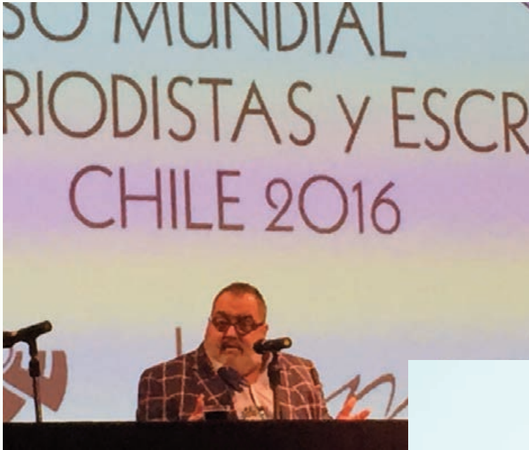
阿根廷知名記者 Jorge Lanata 籲媒體人尋求真相、報導事實。