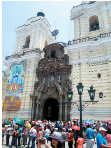
人骨教堂前朝聖還願的人大排長龍與街頭印地安小販。

11月29日早餐後，我們又到利馬機場搭乘飛機往庫斯科古城，飛行時間約一小時。庫斯科海拔3450米，曾經是神秘的古印加文明的中心。我們剛飛抵庫斯科，天空就下起雨來，氣溫也驟降。入住Econ Inn小巧的四星級旅館時天氣又放晴了，放下行李隨即到隔壁的餐館午餐。