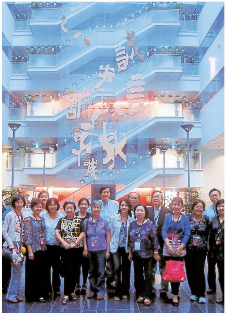
本會姊妹參觀台中市政府新建的市政大樓。

話說我參加本會，原有些「陰謀」。9 年前，我參加剛創辦的「台灣銀髮族協會」，提出了「藝文講座」點子，並被推為主持人，每月一次找人來給老人演講。不久發現，講文學太嚴肅了，老人聽久了會打瞌睡。我便把餅做大一點，不拘內容，只要於人有益並學有專長的，三教九