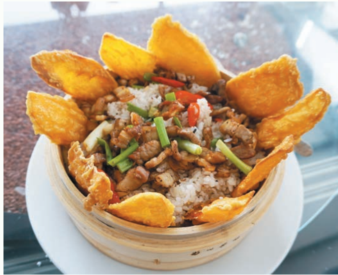
怡明茶園的客家創意料理。