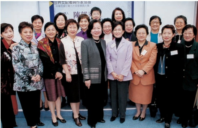
王力行任內邀請文建會主委陳郁秀演講（左五）。

美金。加上新聞局的 10 萬台幣，在當時預計有 4 位代表出席的情況下，經費總算踏實了。