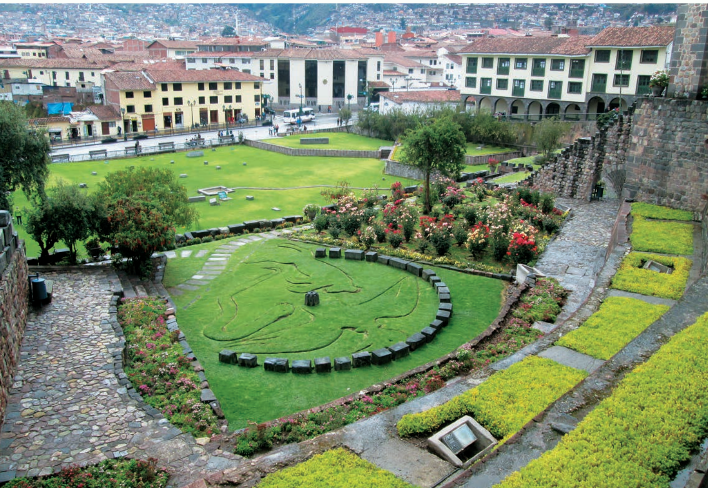
太陽神殿內部不能拍照，只好把鏡頭對著戶外庭園。

下午安排城市觀光：太陽神殿 Qorikancha、中央廣場、大教堂、聖水殿、參觀印加帝國時期的重要之軍事要塞－薩薩瓦曼 (Saqsawaman) ，昔日每天動用三萬人次，歷時 80 年才建成的巨型石埕城塞，面積達 2,997.26 平方公尺，自