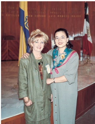
林芝和加拿大會長瓦許夫人。