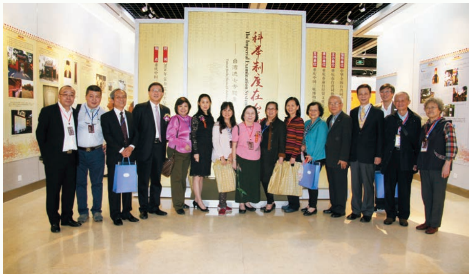
AMMPE 部分成員出席重慶台灣周活動。