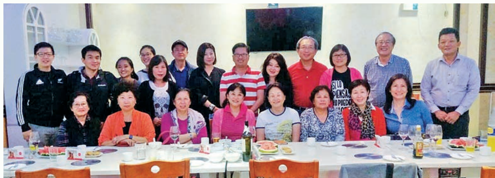
秘魯台灣僑胞人雖不多卻熱情洋溢。

晚上，牡丹會長又請大家吃秘魯火鍋，雖然店家的電磁爐臨時斷了電，我們換了座位，繼續餐敘，短短的一天兩夜，陸續聽了這些台商在異鄉奮鬥的故事，他們樂觀前進的勇氣、不屈不饒的精神，怎不令人敬佩！