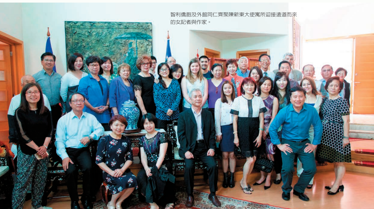
智利僑胞及外館同仁齊聚陳新東大使寓所迎接遠道而來的女記者與作家。