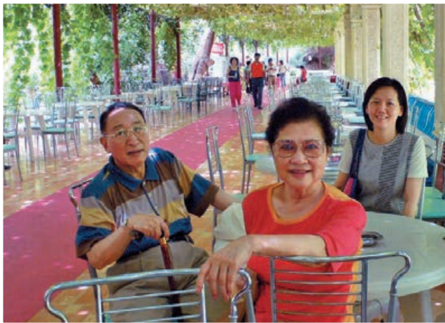
陸以正大使（左一）是引領本會加入國際社團的牽線人。