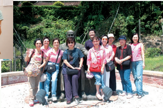
結伴參觀後慈湖蔣公園區，與蔣公銅像合影。

他合照，彌補了年輕時的遺憾。最近毛澤東逝世40周年，大陸官方雖無動作，但民間仍很多人站出來紀念老毛。在台灣，10月31日已不再放假，除了老蔣的侍衛長郝柏村會想念他以外，台灣人幾乎已經無感。這就是成敗兩樣情吧！