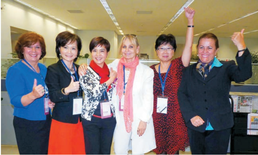
2012 年在台中市舉辦國際年會時理事會議後合影。

勃勃辦了 22 場校園座談，向莘莘學子傳遞寫作及新聞傳播上我們始終堅守的信條，希望對未來的作家及記者產生正面影響。