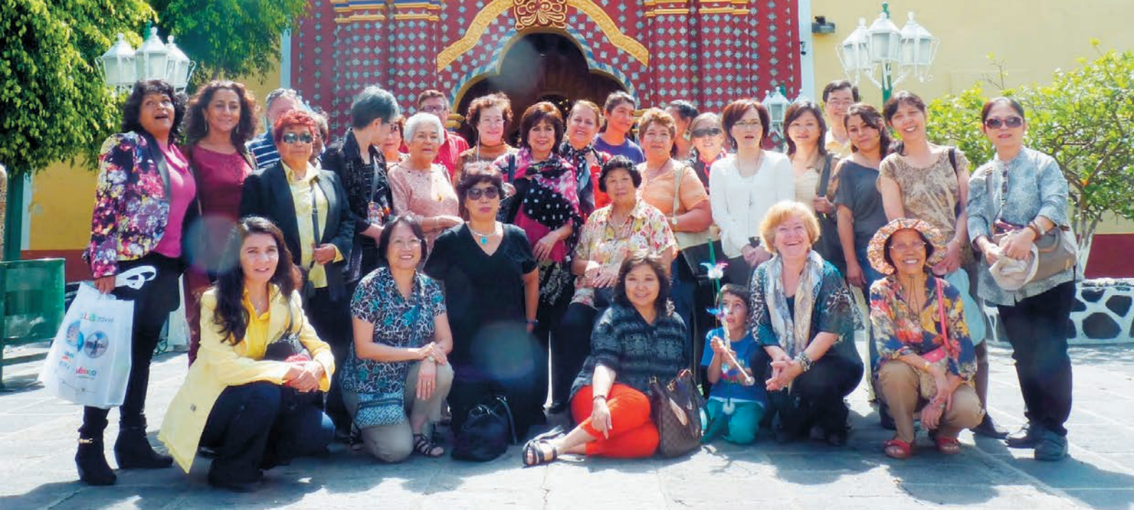
2014 年墨西哥克雷塔羅國際年會閉幕全體合影。

先利用 2014 年底開年會時，請攝影師到場替每位會員拍沙龍照，再請工程師設計網頁加在網站上 ( http://www.ammpe.tw/ )。這個工程已經不簡單，還得補當天未到場拍照的會員照片和簡介。其間來來回回的聯絡、校對，工作極為繁瑣，我也是常常工作到深夜。最後結果差強人意，後續新進會員的照片簡介，就有勞新的網站負責人了。會員通訊錄的更新和會籍整理建立電子檔，我也花了許多工夫。相信後面接棒的人繼續維護會輕鬆許多。