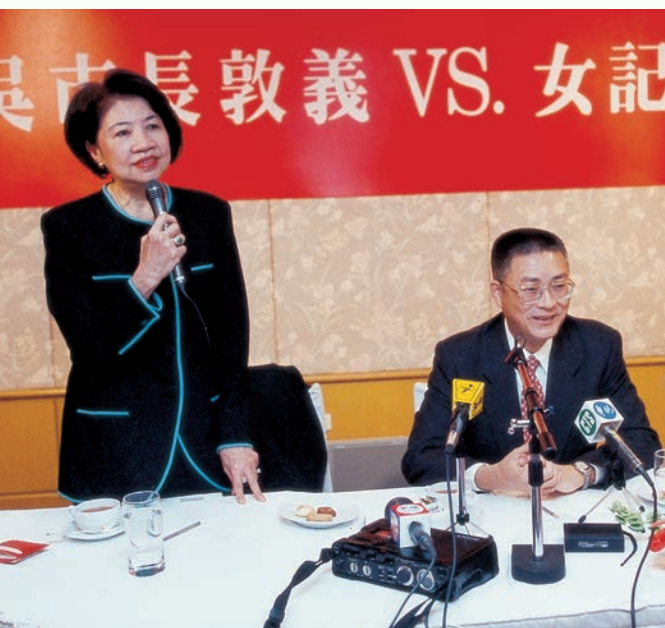
蘇大姊任內舉辦多次「市長系列」座談。

我很幸運，有這份機緣在 AMMPE 這個大家庭裡度過快樂的 30 年，享受眾家姊妹給我的溫馨！漫漫歲月，生活中的成長，工作裡的磨練，以及友情上的收穫，都是我生命最珍貴的經驗與寶藏。