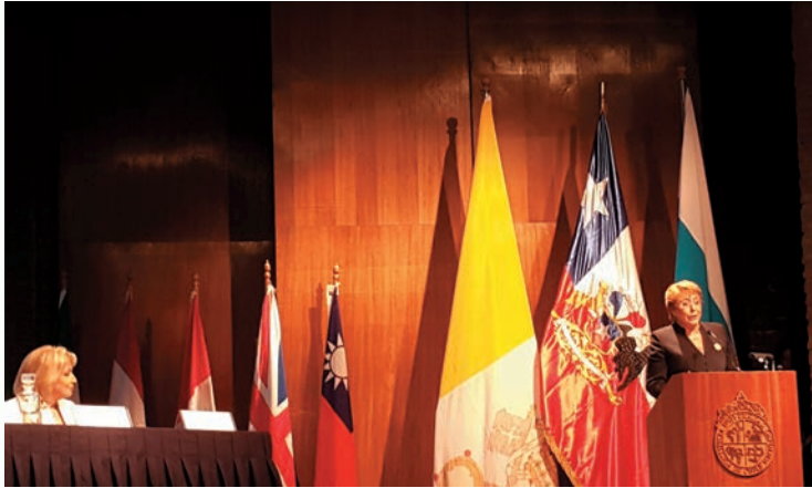
智利女總統 Bachelet 應邀在會中致詞。

經濟文化辦事處合作，安排了一個別出心裁的「光影。敘事－台灣女性攝影家作品展」，在天主教大學推廣中心的中庭廣場配合展出。首日上午開幕典禮後，由陳新東大使主持揭幕式，邀請與會各國代表及大學學生觀賞。這是前所未有過的安排，尤其我國與智利目前並沒有正式的邦交關係。