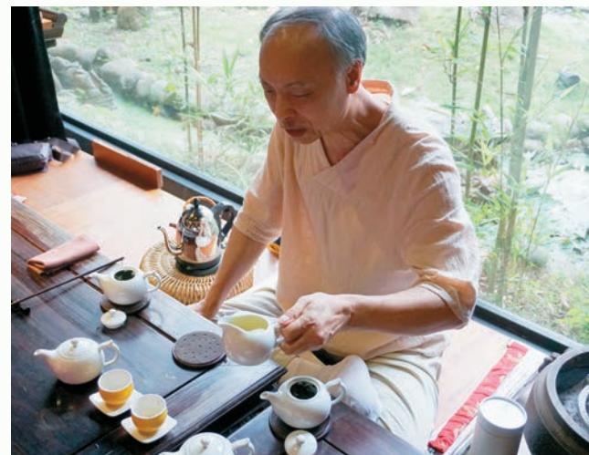
品茗凝聚了大家的焦點。