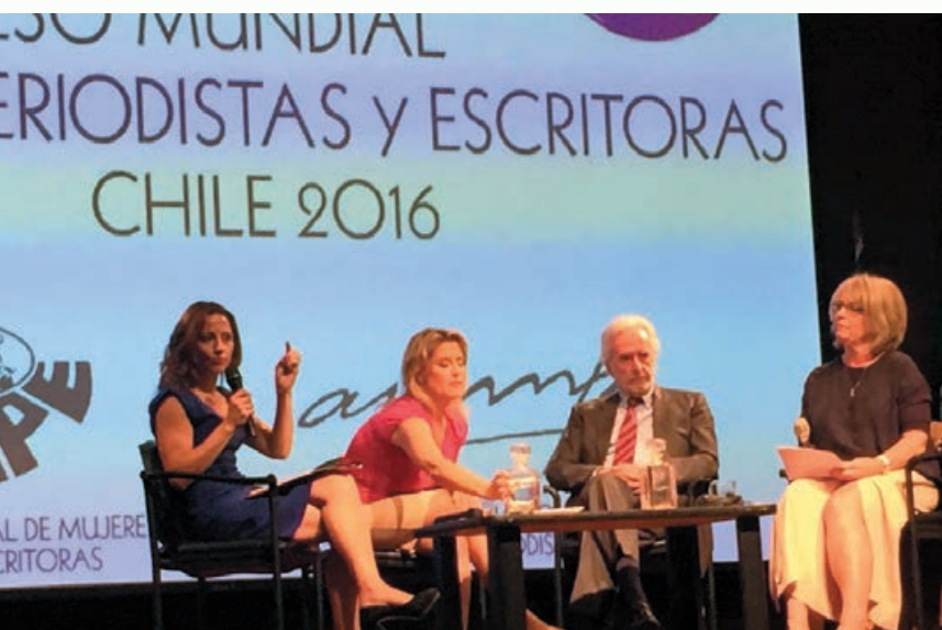
論壇中每每論及出乎意料之外的美國大選結果。