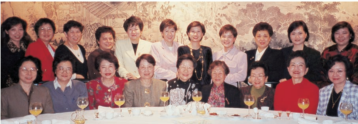
30年前本會理監事的陣容。

世界女記者與作家協會中華民國分會，屬於國際組織下的分會，是一個很獨特又活躍的分會。