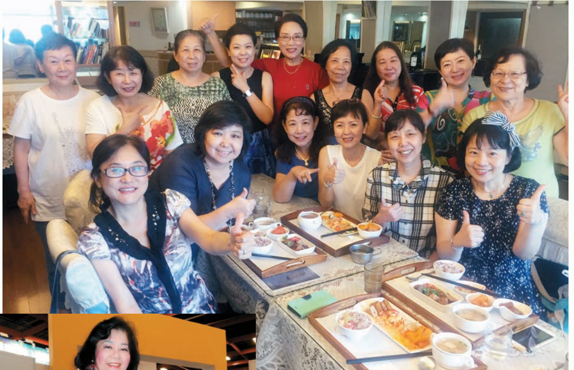
歡唱團定期在 113Cafe 練唱後餐敘合影。