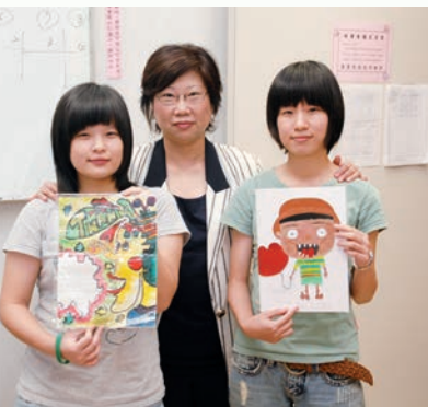
義賣所得捐助家扶中心辦助學獎金。