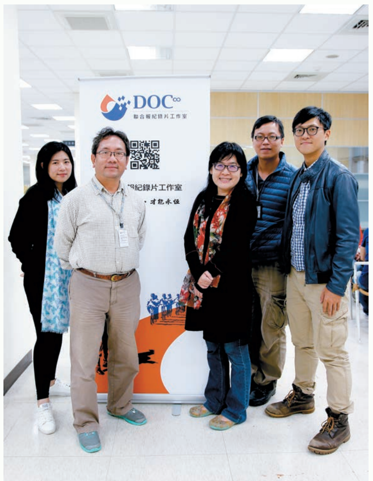
聯合報紀錄片工作室團隊合照。