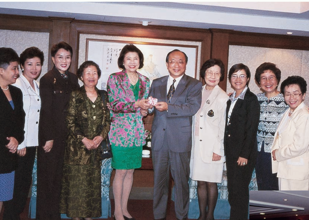
胡志強任新聞局長時蒞臨本會會員大會與理監事合影。