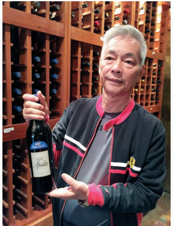
這是一瓶價值200美元的好酒。

他的農場86公頃草原一望無際，莊園前方還蓋了間可容納上百人的宴會廳，智利的僑胞們每逢年節會在此聚會聯誼，許多智利年輕人也喜歡在此宴客結婚。而目前他和妻子2人所住的莊園佔地6公頃，6公頃是什麼概念呢？換算成台灣習慣用的坪，是18,000多坪，台北所謂豪宅最多不過200坪，就可以想像其大其美了。莊園內，不但有豪華的美宅，庭園更有如大型熱帶公園，那些壯碩的樹木都是他和工人