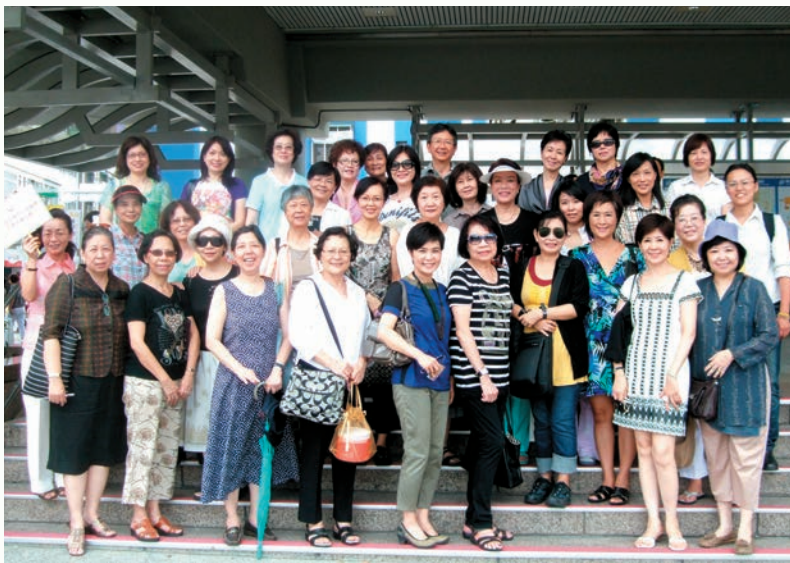
2011 年率會員們參觀花博留影。