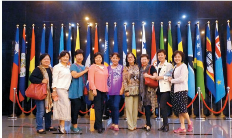
演講結束，姊妹們到講台與邦交國國旗合影。

夏立言任職國防部軍政副部長時，透過靈鷲山心道法師協助，將在滇緬戰役陣亡的國軍將士英靈迎回大陸，全部花費由