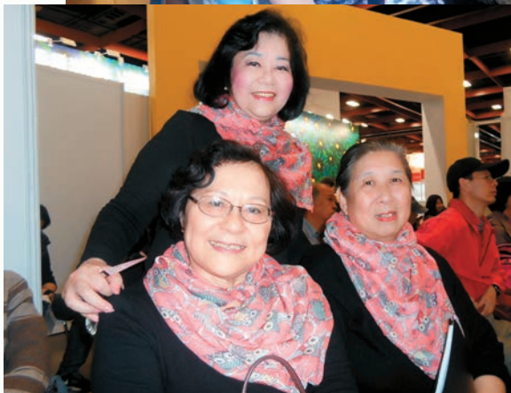
應邀參加北一女校友會綠園藝文展揭幕並演唱。

最見效率成果的是今年 3 月，邀請大陸委員會主任委員夏立言演講。演講當天，與我斷交 2 年的甘比亞突然與中共建交，夏主委不得不赴立院備詢而臨時取消。上午 9 時本會秘書處接到訊息，立刻發出取消演講的通知。大家都很耽心只有短短的 4 小時，總會有人沒能及時接收到訊息，而跑到會場。立刻要收到訊息的成員在 Line 中回覆，沒想到 50 多位報名參加的會員，幾乎都傳達到，只有 2 位因為早上沒看手機及電郵而沒有收到訊息。