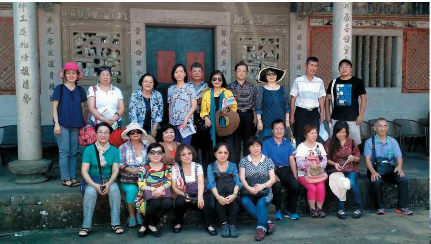
參加台三線客家庄浪漫行的姊妹與客家筆會文友合影。

我們出發了。看似不遠的路程，卻也讓我們讓車子在國道與縣道間奔馳，我們像期盼出遊的童稚，忍不住的開心在臉上笑著。