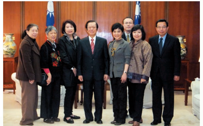
外交部長楊進添（中）贊助 2012 由本會主辦的台中國際年會。