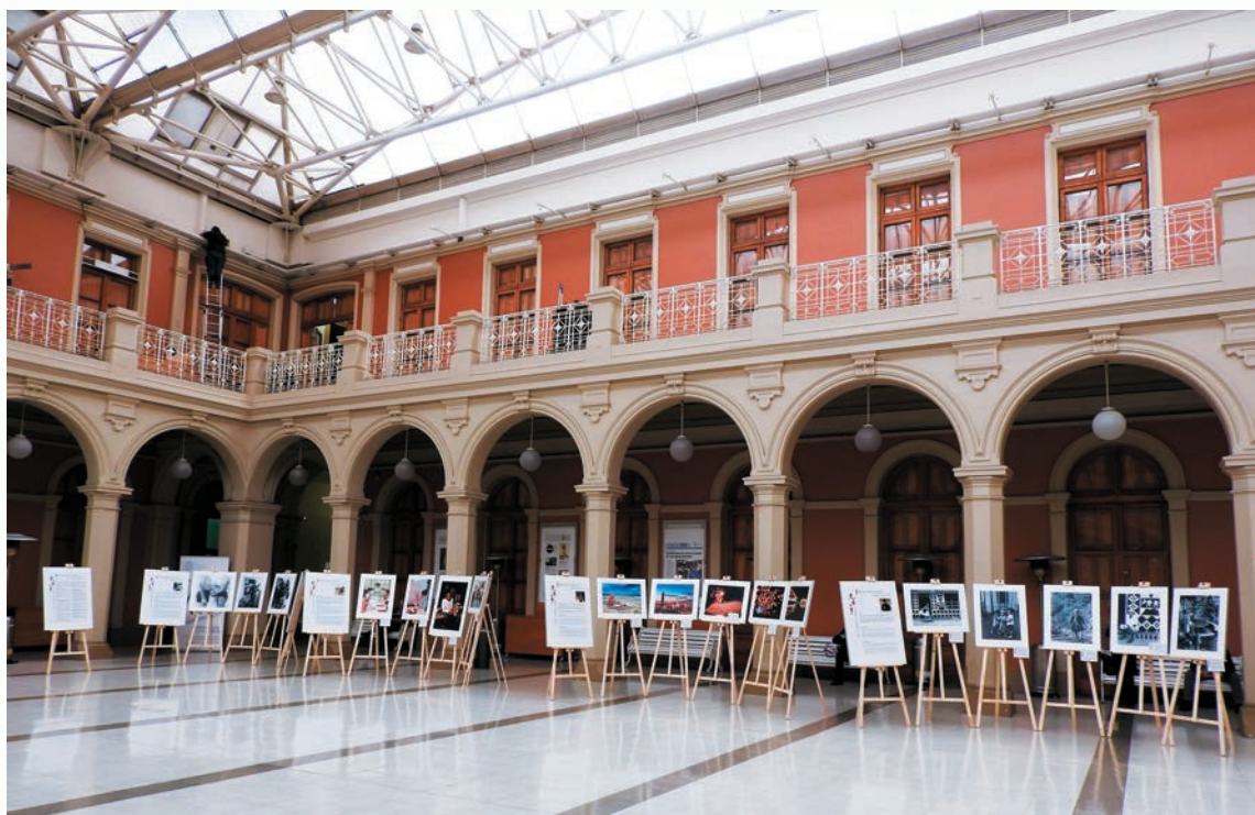
女攝影家的作品展示出台灣在地豐富的生命力。

這次世界女記者及作家大會，台灣婦女的身影透過一項攝影展，給予智利當地人深刻的印象。