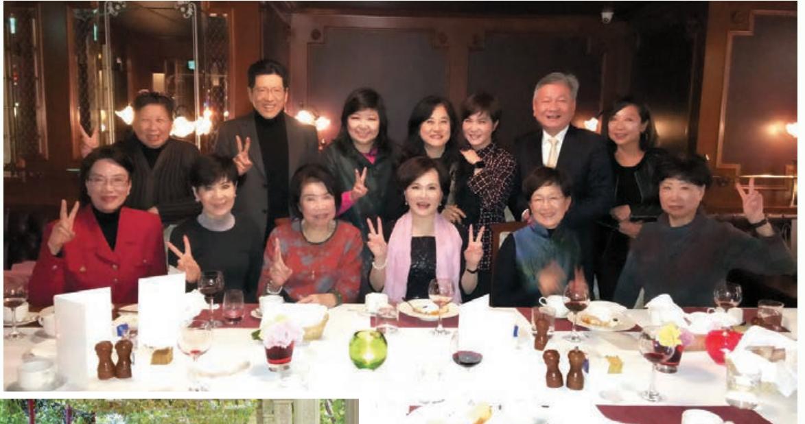
本會理監事年會與嚴總裁長壽和陳董事長大松歡聚。