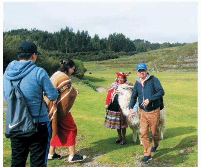
導遊手中展示印加時代馬丘比丘的面貌，我們一行漫步在遺跡裡想像。

30日早上，我們摸黑起床趕著搭乘 6:40 出發的觀光火車，約 4 個小時的車程，我們在火車上享用早餐，前往被選為世界 7 大奇觀的印加帝國遺址馬丘比丘，火車是 180 度觀景，沿途風景美不勝收。古城建在懸崖峭壁上，分成數個區域：墓園、監獄、生活區和神殿區，全部由原石砌造、工藝精湛，體現了當年印加王朝的盛世輝煌，是當年印加帝國的聖地，也是最高祭師居住的神殿。曾挖掘出 150 具女性骸骨，是祭典中獻給太陽神的祭品，古城因此被列為世界十大文明之謎。午餐在山下餐廳匆匆用餐，大夥兒利用候車的時間，鑽進車站旁的商店，忙著採購藝品。