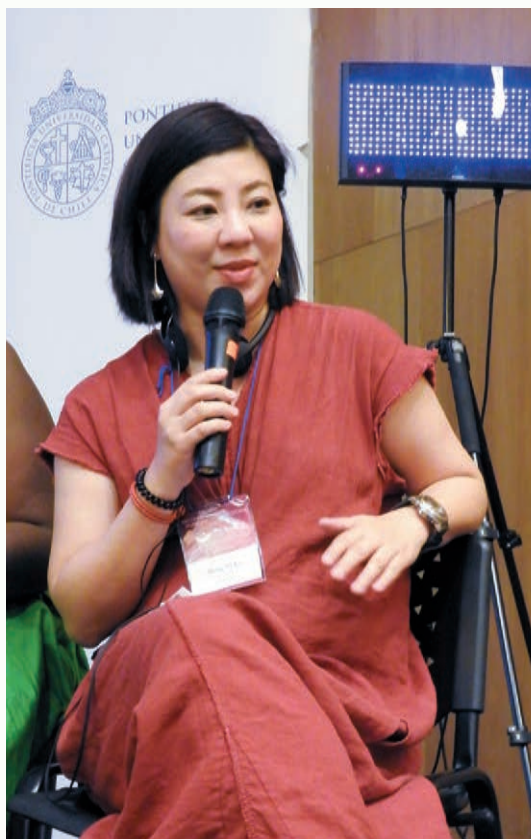
顧名儀答覆台下提問時神情愉快。

Conversational Computing: 取代評論，觀眾可以更直接地和編輯溝通，讓編輯更容易了解各方不同的想法和觀念。