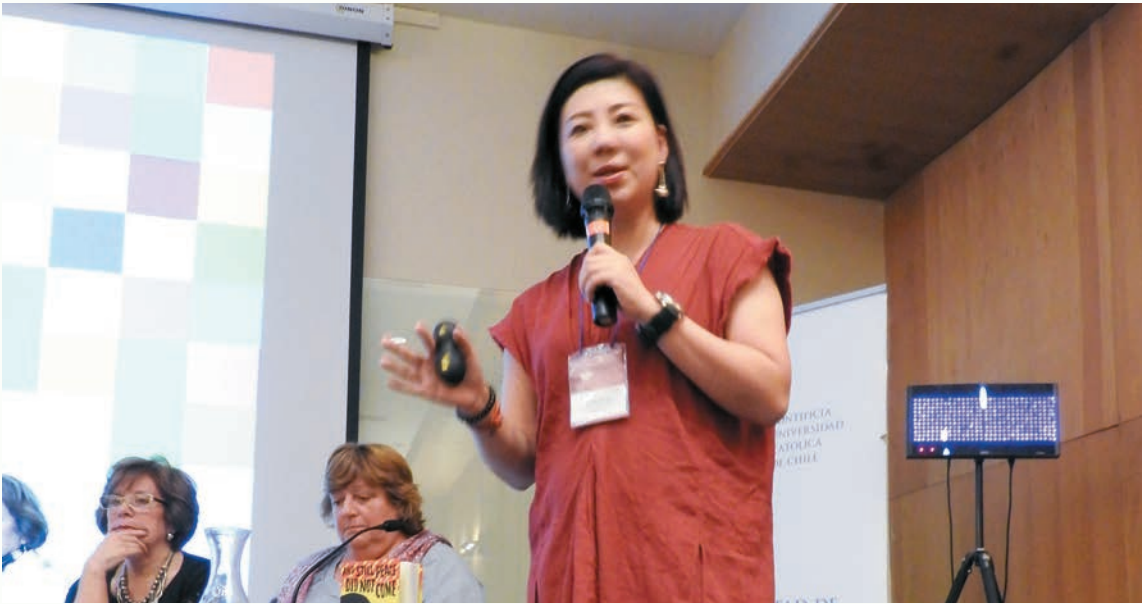
同台的有墨西哥、智利、西班牙及賴比瑞亞的代表。

購的攝影器材、SNG 設備、工作人員繁複的拉線準備工作，幾乎都可被取代。手機打開接上網路直播，一切都變得如此迅速、輕巧、便捷，甚至記者的功能可能都要被取代部分了。」