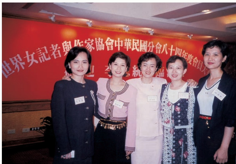
20 年前的我們有多年輕啊！