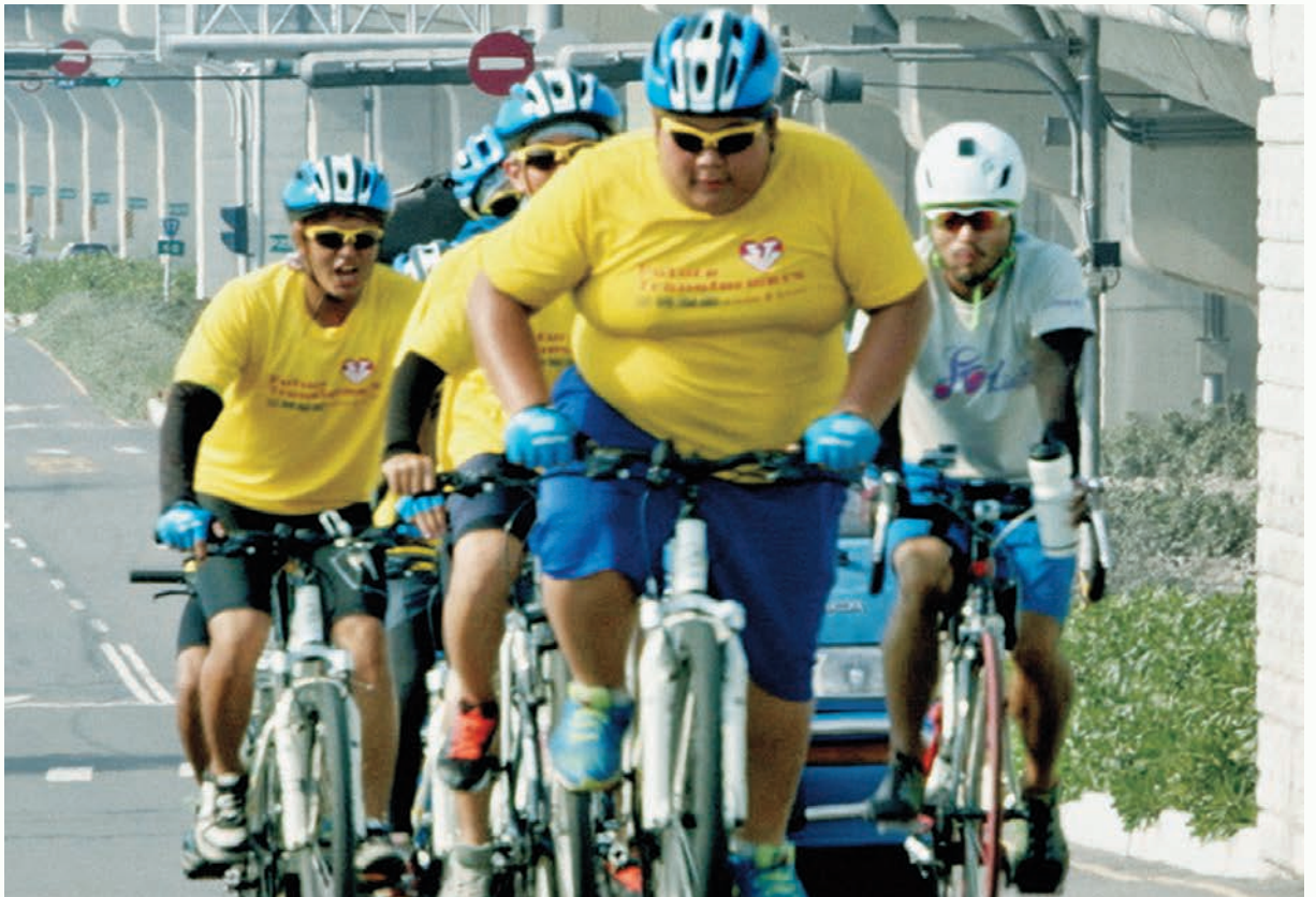
逆轉騎士記錄 60 個孩子單車環島的故事。

響，我們不以為異，大家繼續工作，一會兒又一聲異響，我們仍繼續工作，快睡覺前，嘩拉第三次異響，這回整個床墊掉在地上，我們才發現原來是那些床板一塊塊塌落的聲音。還有一天，我們住在招牌上寫著「大飯店」的地方，裡面設備陳舊，彷彿時光倒回民國 60 年，我房間的白床單，泛著歲月的灰色，中間一大塊黃色汗漬，我側著身體睡，盡量減少和床接觸的面積，但第二天看孩子們的日誌，有人在「今天最感恩的事」欄目下寫著「住好好」，我熱淚盈眶，從此不敢抱怨。