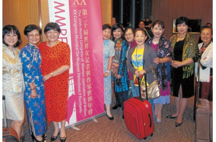
第 20 屆國際年會在台中盛大舉行。

鋒利的個性，反而給人一種平實、豁達的感覺。她為 AMMPE 樹立了「有容乃大」的風格，從她身上我學到了寬闊的人生觀！她給了我一台人生的望遠鏡，也打開我生命的新視野。