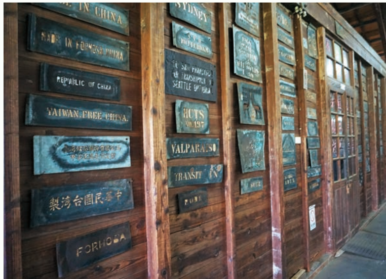
茶箱的金屬刷版充滿滄桑。

每面牆、每個迴廊，或是每扇窗影間，都訴說著 70 多年來的製茶故事，從紅茶、煎茶到綠茶，他們的茶葉得過不少獎項，公司名稱雖有「紅茶」二字，其實早就在 60 年代改為製作綠茶，這是