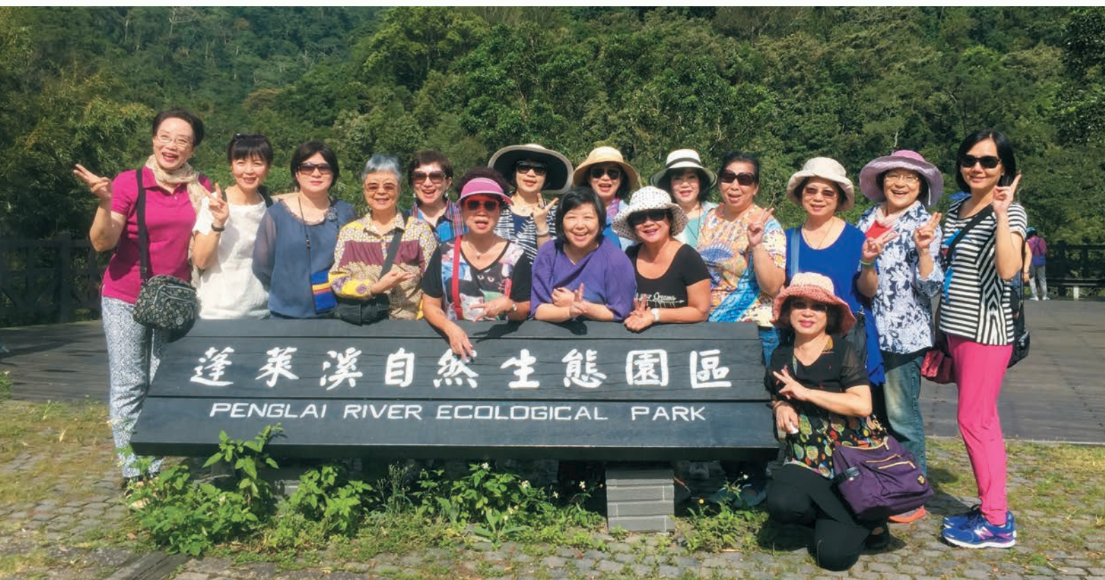
蓬萊溪護魚生態步道，木林蒼鬱，在鄉民努力下封溪護魚有成。