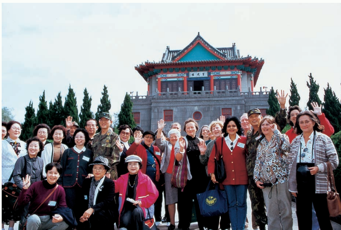
1996 年第 13 屆國際年會後去金門參訪。

AMMPE30 周年了，我是在成立一周年時加入的。那天大會創會人余夢燕主持，林海音、邱七七、梁丹丰、華嚴、趙淑敏、殷張蘭熙、羅蘭很活躍，是啊！記得多半是作家，官麗嘉跟宋楚瑜（文工會主任）要了補助費開年會。