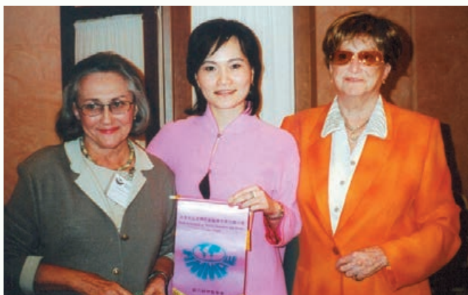
2004年10月在西班牙薩拉曼卡，沈春華被推選為第17屆「世界女記者與作家協會」（AMMPE）總會長，從創會會長卡德隆女士（Gloria Salas de Calderon，右一）手中接過象徵傳承的紀念幣。