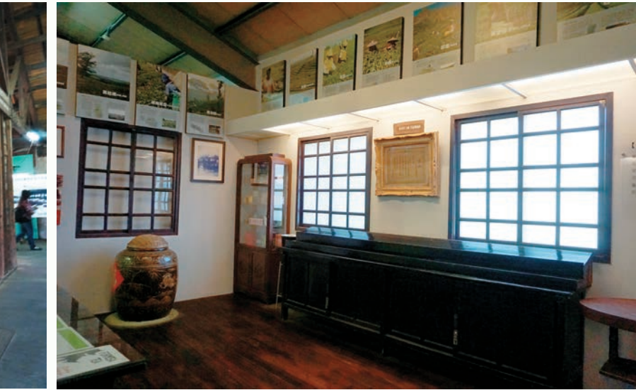
頗具歷史的審茶室。