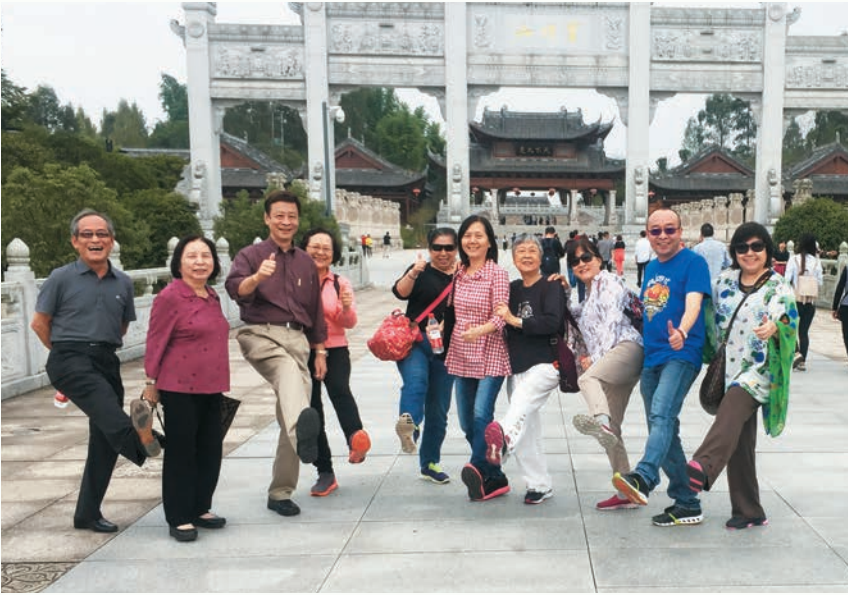
參觀大足石刻時，團員們紛紛抬起自己的「大足」，留下這幅有趣的畫面。