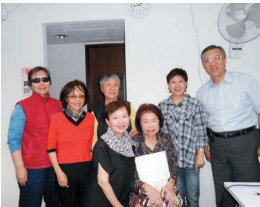
本會熱心贊助喜大人協會的活動。

我返台定居 20 年了，參加過許多文藝協會，包括自己創辦的海外華文女作家協會，擔任過中國婦協的理事長，林林總總，但認真細數，還是當世界女記者與作家協會中華民國分會（以下簡稱女記協）的會員，時間最短但收穫最大。