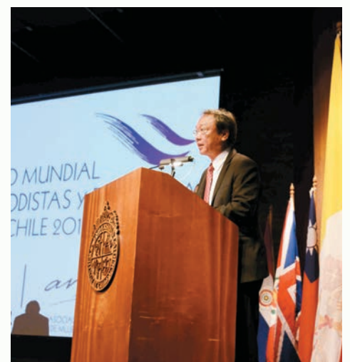
我駐智利代表處陳新東大使為台灣女性攝影展揭幕並在大會上致詞。