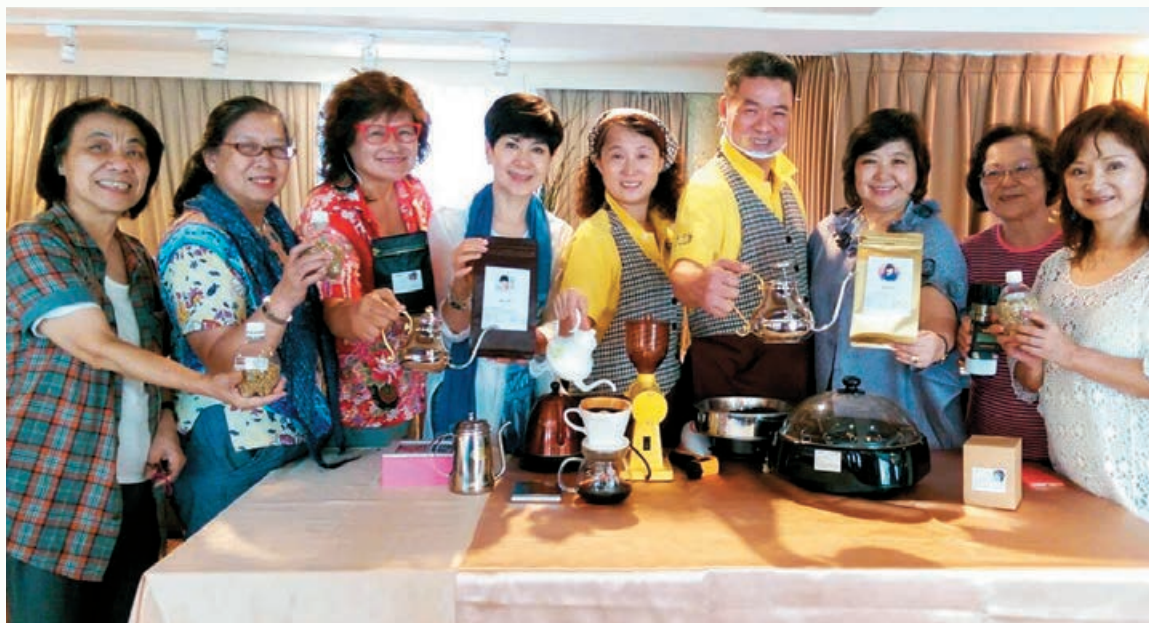
宜蘭採梨行時，大家順便學烘焙咖啡。