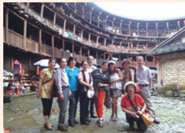
▲土樓成為世界文化遺產後，仍有許多住民生活其中。

廈門住兩晚，我們又去不是一般遊客熟悉的趙家堡，趙家堡是宋亡後，宋皇家第十世皇孫改姓黃，躲元兵在漳浦縣湖西；明代好幾位後人在科舉上有了功名，得明皇帝之賜，改歸原姓，全城堡名為「完璧樓」取「完璧歸趙」雙關意思。此被評為福建十大最美鄉村之一，也是歷史文化名鎮。趙家堡建得具有城堡的規模，外城千餘米長。