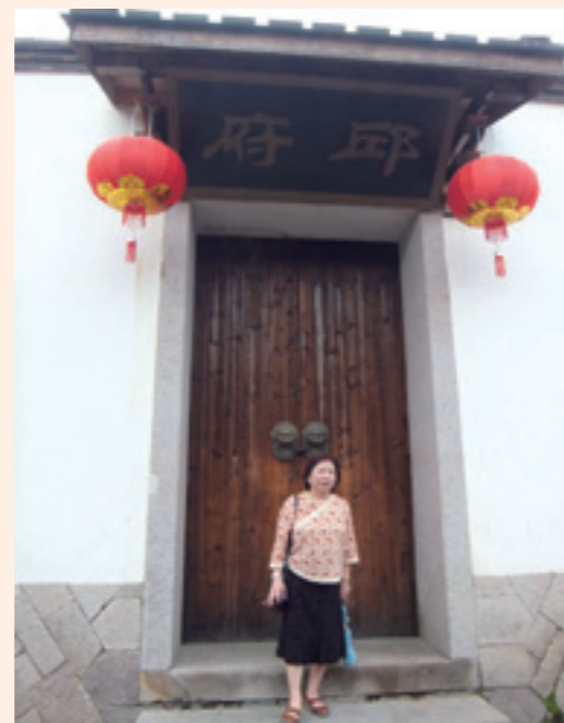
▲丘大姐在一戶丘府大宅院前留影，饒富趣味。

相較之下，南靖和永定土樓群又是另一種各姓家族自成防禦外侮的建築。永定的土樓以前我去過，這回在南靖，我們一個個土樓去走，田螺坑，土樓成群，有方有圓，步雲樓、裕昌樓、和