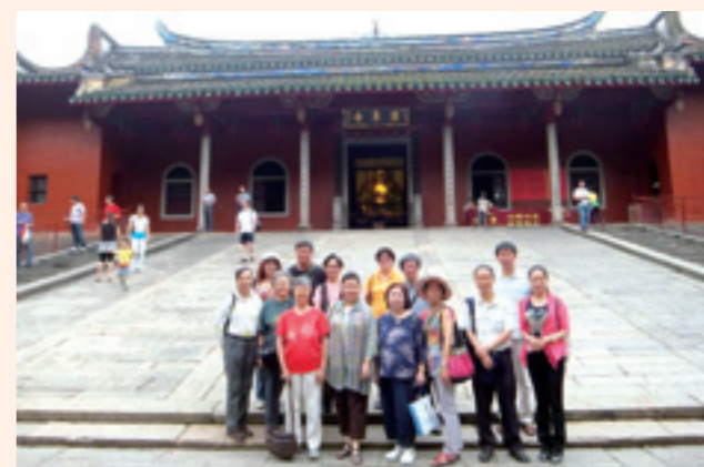
▲福州名勝鼓山，成為市民踏青的好去處。

我們夜宿雲水謠招待所，懷遠樓就在附近，電影〈雲水謠〉，電視連續劇〈滄海百年〉就在這地拍攝的。