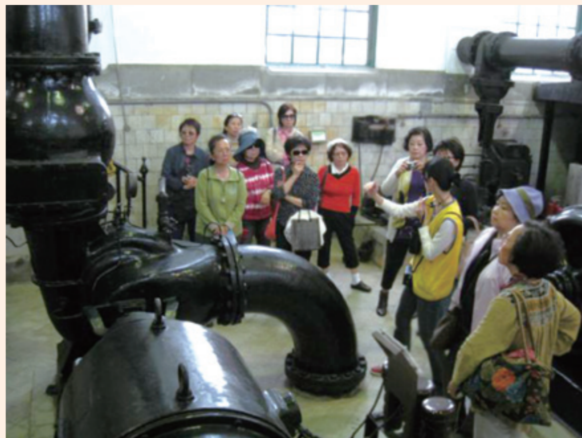
▲ 在自來水博物館內，會員聆聽館內導覽人員的解說。