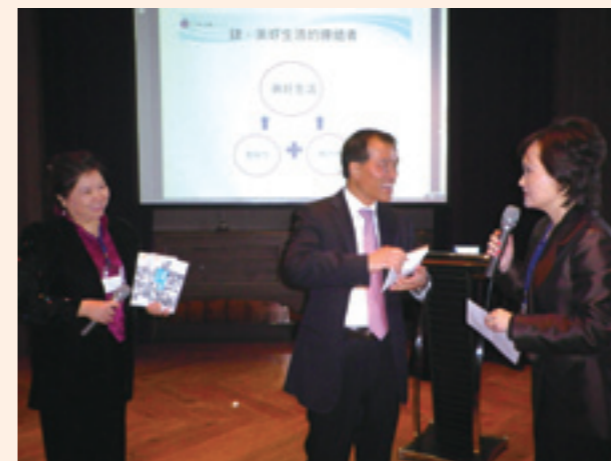
▲葉部長不只捐出演講費，還加碼捐本會行政基金。

準時到來的交通部長葉匡時，風采翩翩，以「交通——連結美好生活」為題，講述「推動桃園航空城、便捷公共運輸、提昇觀光品質、打造鐵道新遠景、扎根強化道路安全及積極招商協助產業發展」等六大重點，獲得熱烈迴響，台中市文化局局長葉