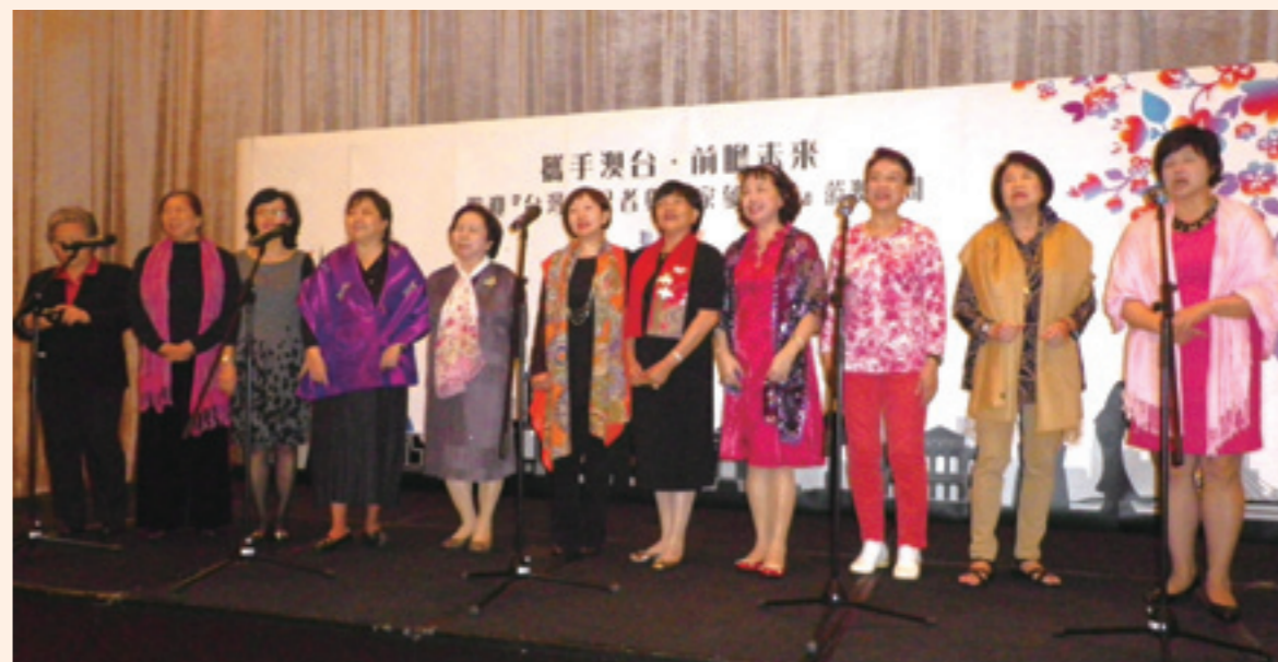
▲ AMMPE 歡唱團抵達澳門第一個晚上，在正式晚宴之後，登台表演，贏得熱烈掌聲。