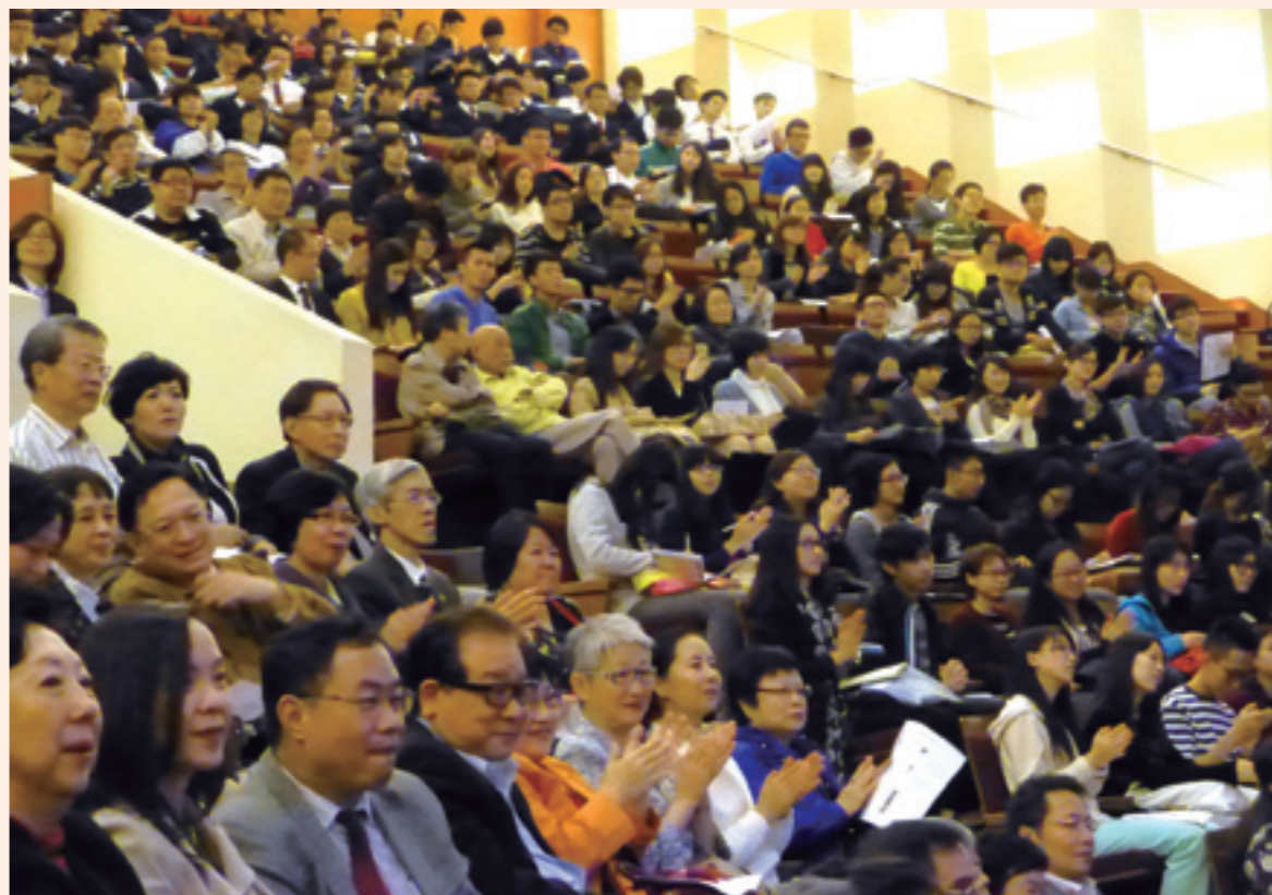
▲台灣面面觀座談會星光燦爛，吸引滿場聽眾。

她表示，澳門近年善用博弈產業資源，投入各項文化創意產業的開發，把「文化城」的人文精神找回來。而臺中市則在官方與民間共同攜手下，成為一個處處充滿驚喜、值得用感官、用心去體驗的城市。兩個曾經蒙塵的城市，都正努力用文化，讓城市亮起來！