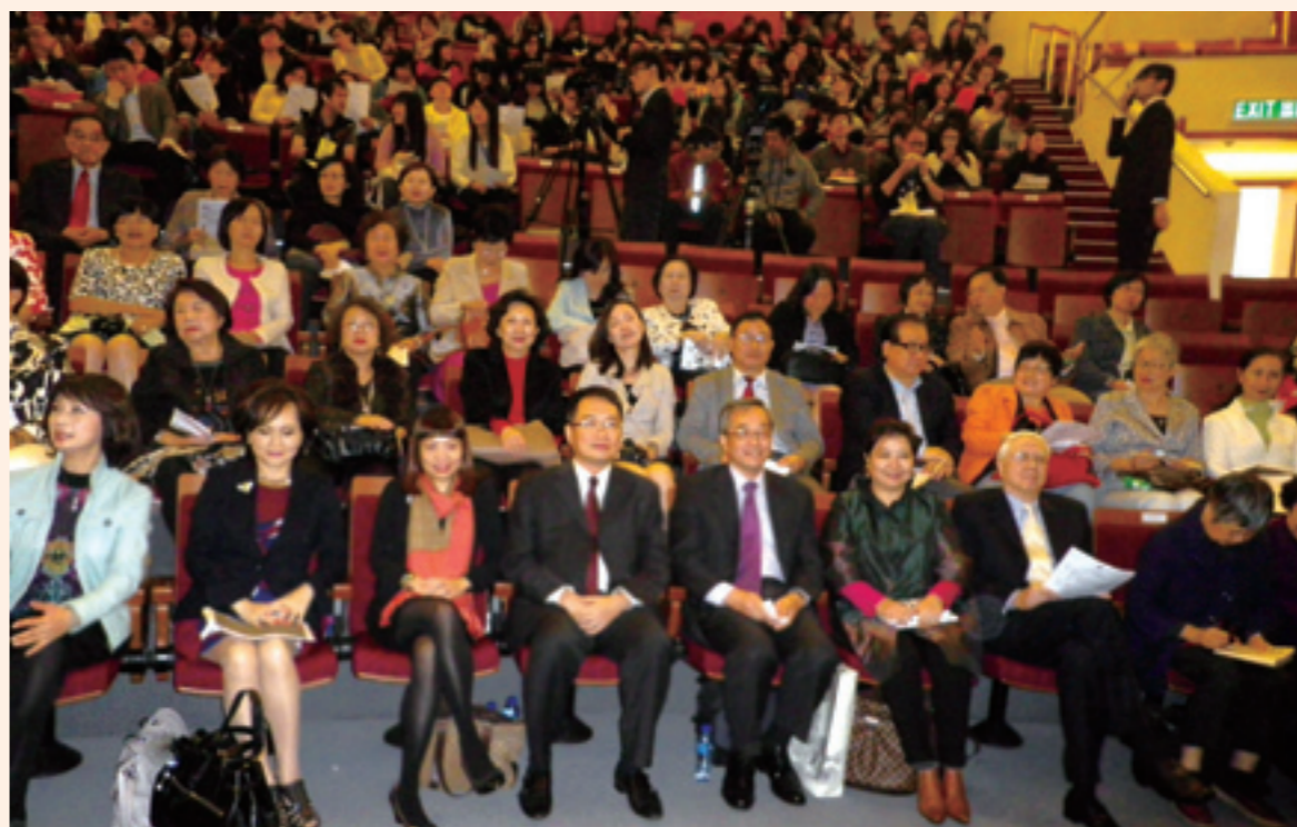
▲參訪團成員及澳大師生在台下專心聆聽。

另一位博士生李冰雁對女作家溫小平也進行認真解讀，朱壽桐教授啟發她在評論時著重傳達出作家對歷史、對生命同情的理解。李冰雁的演講辭也幾次修改，她寫道：溫小平女士是一位多產的作家，迄今已經創作超過 80 部著作，創作文類包括散文、小說、傳記與兒童文學等。她的「溫情私語系列」小說、《天母不了情》等旅行文學，以及大量的散文、影評，不僅深受不同年齡階層的喜愛，還開拓了兒童文學、青春少女文學、旅行文學的類型和表達形式。她對當代旅行文學寫作的貢獻值得褒揚。臺灣的旅行文學極其繁盛，從早期文辭優美的遊記如余光中的《隔水呼渡》、葉維廉的《歐羅巴的盧迪》等，到七八十年代三毛的《撒哈拉的故事》、《稻草人手記》、《哭泣的駱駝》、《溫柔的夜》風靡海內外，形成轟動文壇的「三毛現象」，這些優美的遊記散文都極大地開拓了漢語新文學的表現