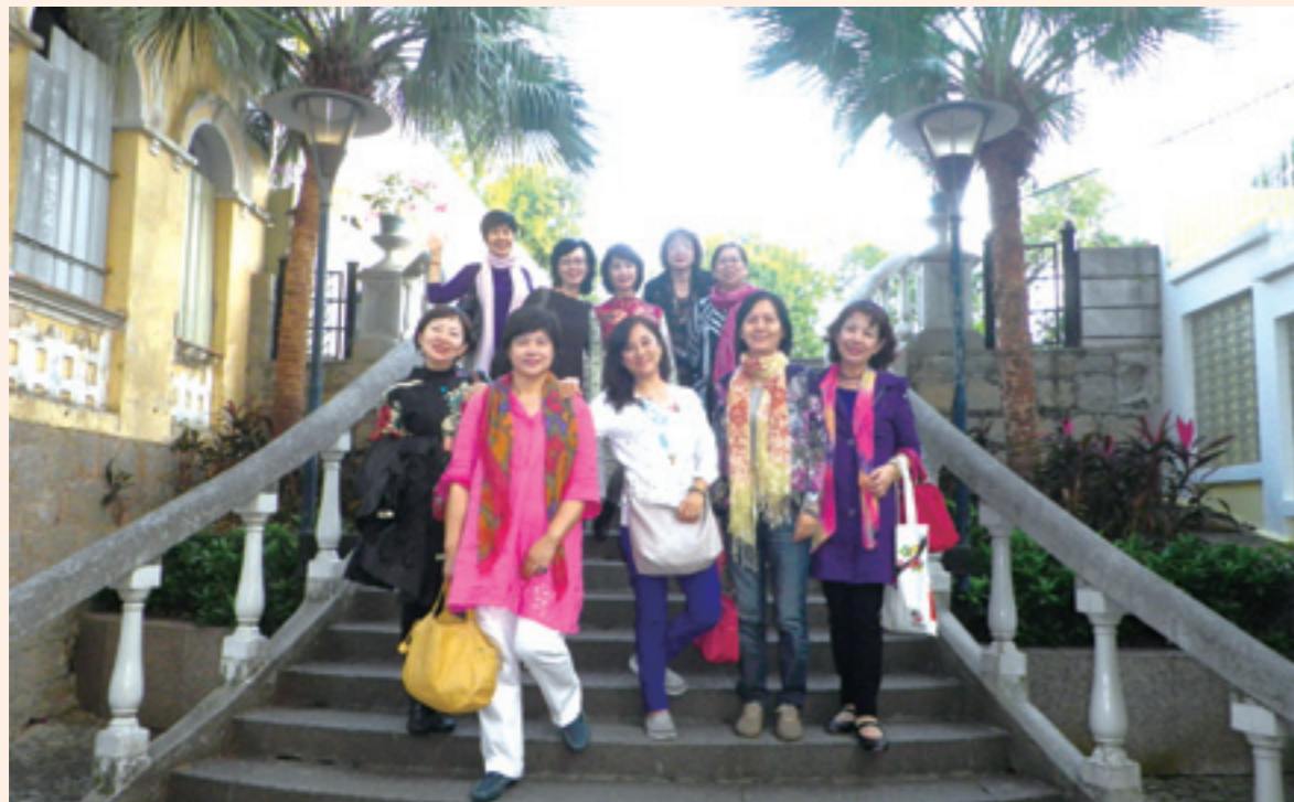
▲澳門小巷風情，可以看到不一樣的澳門。