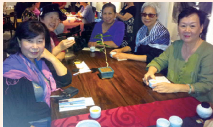
▲本會會員應邀出席水墨茶席，享受高雅悠閒的午後。