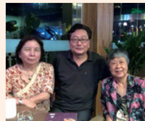
▲廈門作家和若曦姐、秀芷姐相見歡。