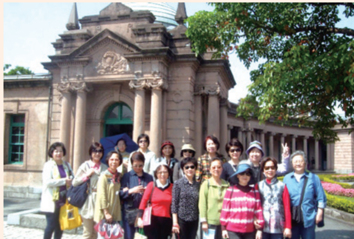
▲ 2013 年 3 月 12 日參訪當天風和日麗，是踏青好時節。

在水資源日，當你扭開水龍頭時，享受潔淨價低的自來水時，就開始身體力行「節水」吧！