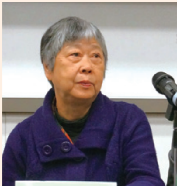
▲陳若曦講傷痕文學在台灣。