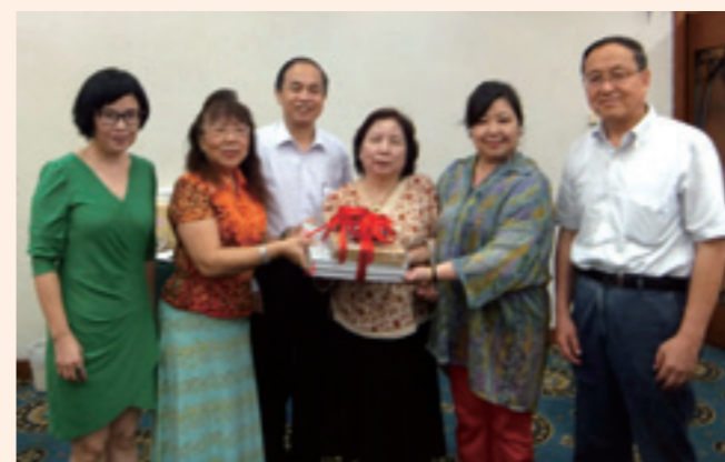
▲與廈門大學教授及作家進行交流。