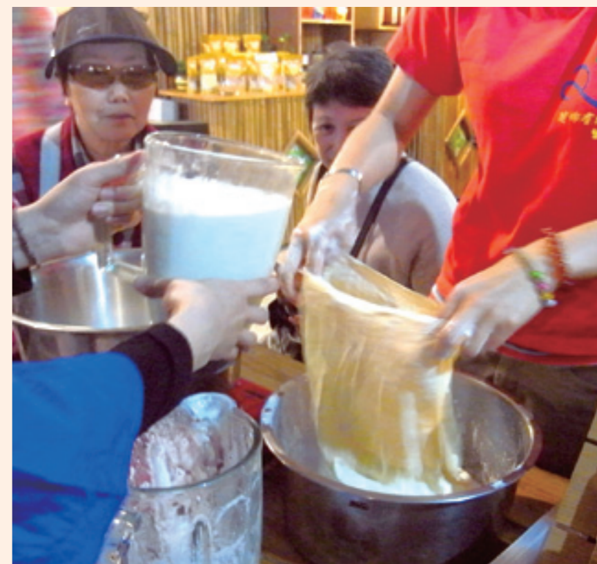
▲豆子加水在果汁機打成汁後，倒入布袋內搓出豆水。

接著，將濕布的四邊覆蓋在豆花上，再放方型木板入木框中用力壓出水份，倒扣在木板上，拿走木框和濕布，有機豆腐便呈現眼前，切小塊，大家趁熱嚐鮮，因為放鹽鹵，有一點點鹹和一點點苦，但也有從未吃過的黃豆甜味，有機豆腐健康又好吃，吃多了不會結石，與菜場所賣加石膏的豆腐很不一樣。