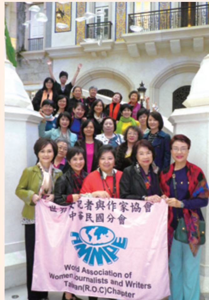
▲本會澳門參訪團員 2013 年 11 月 28 日在澳門 MGM 大廳展示本會會旗合照。

2013 年 11 月 24-27 日的澳門參訪之行，出乎預料的圓滿成功。我團陣容堅強，群星燦爛，受到澳門各方面高規格接待。澳門大學更對我團的參訪極其重視，舉辦了三場座談會，師生反應熱烈，我團 12 位與談人也做了充分準備，發揮長才。本期會刊特闢專輯，對此次參訪做完整的報導。