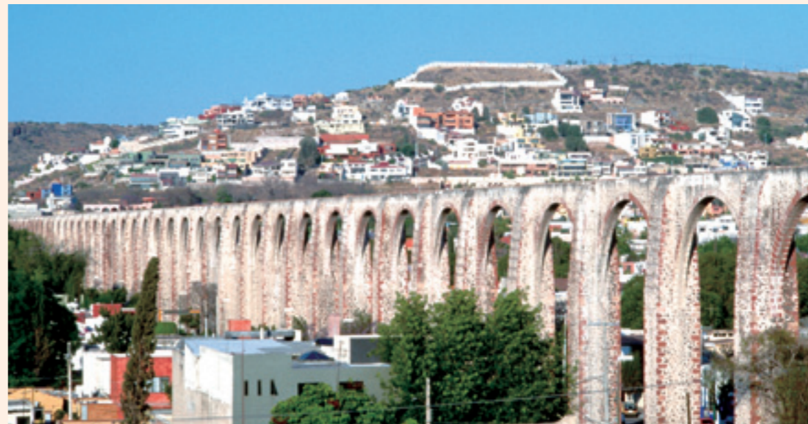
▲墨西哥世界年會舉辦所在的 Querétaro 城一景。