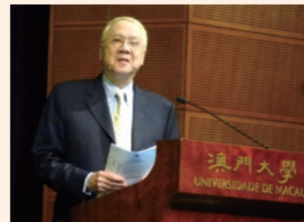
▲國際知名計算機科學家、教育專家劉炯朗教授擔任主場主持人。

台灣女記者與作家參訪團澳門行的重頭戲，由澳門大學主辦的「台灣面面觀——與台灣資深傳媒人對談」座談會，在理事長傅依萍率領下，2013年11月26日下午，在澳門大學文化中心舉行，座談會設有一主場及媒體和文學兩副場。十多位來自台灣的知名傳媒工作者及作家，分別從時事話題、媒體發展、藝術文化、健康生活和文學創作等層面探析，以嶄新角度帶領澳門大學的師生認識台灣。