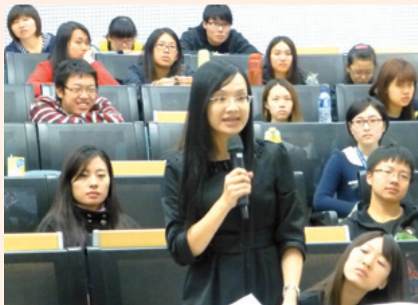
▲參加文學場的澳大學生事前充分準備，踴躍提問。

臺灣女性寫作人、傳媒人代表團以理性而溫潤的視角，著力進行大中華地區文化的溝通與交流，給澳門大學師生留下了深刻的印象。澳大師生認為，代表團的到來以及深層次的交流活動，不僅讓我們更進一步認識了