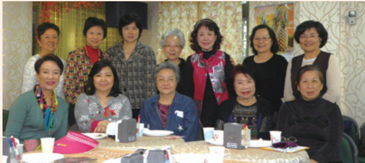
▼歡唱團團員定期聚會練唱。

我也告訴自己：沒關係，我們還有改進的空間。畢竟「歡唱團」主要是帶給大家歡樂的！希望喜歡唱歌，又尚未加入的姐妹們，一齊加入我們的行列吧！