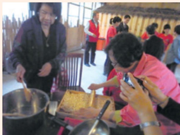
▲親自動手作爆米花初體驗。