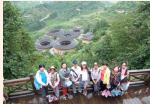
▲四菜一湯田螺坑土樓群。

相較之下，南靖和永定土樓群又是另一種各姓家族自成防禦外侮的建築。永定的土樓以前我去過，這回在南靖，我們一個個土樓去走，田螺坑，土樓成群，有方有圓，步雲樓、裕昌樓、和