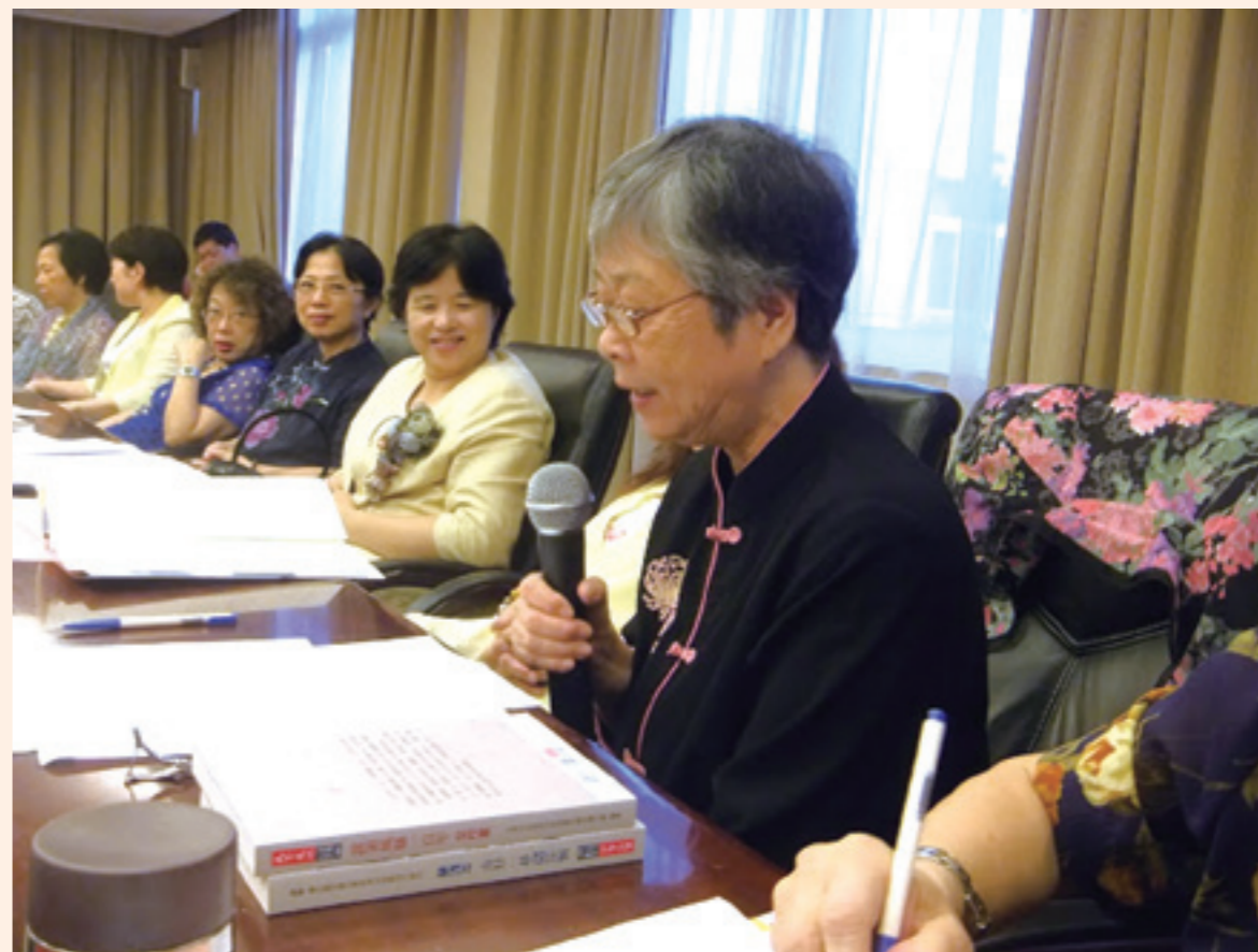
▲兩岸文學座談會交流，大家發言踴躍。